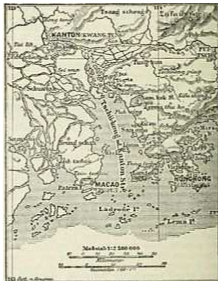
Mapa da Região do Delta do Rio das Pérolas emitido no século XIX.