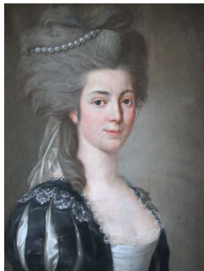
Marquesa de Alorna

aristocrata da alta nobreza pertencia também à mesma sociedade e tal como a Marquesa de Alorna sofreria as consequências.