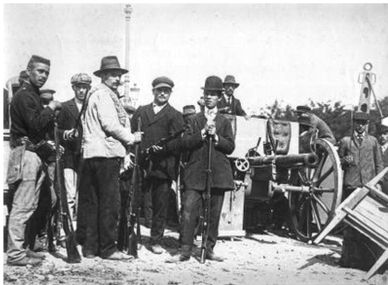
Revoltosos nas barricadas rotunda 5 de outubro.

sua congénere da “Metrópole”. O mesmo não se poderá dizer da Carbonária. Sobre esta associação secreta a bibliografia não é abundante, mas pelo menos existem alguns trabalhos, de certo detalhe, identificando-a essencialmente como o “exército civil” que apoiou os heróis da Rotunda nos acontecimentos que culminaram no dia 5 de Outubro de 1910.