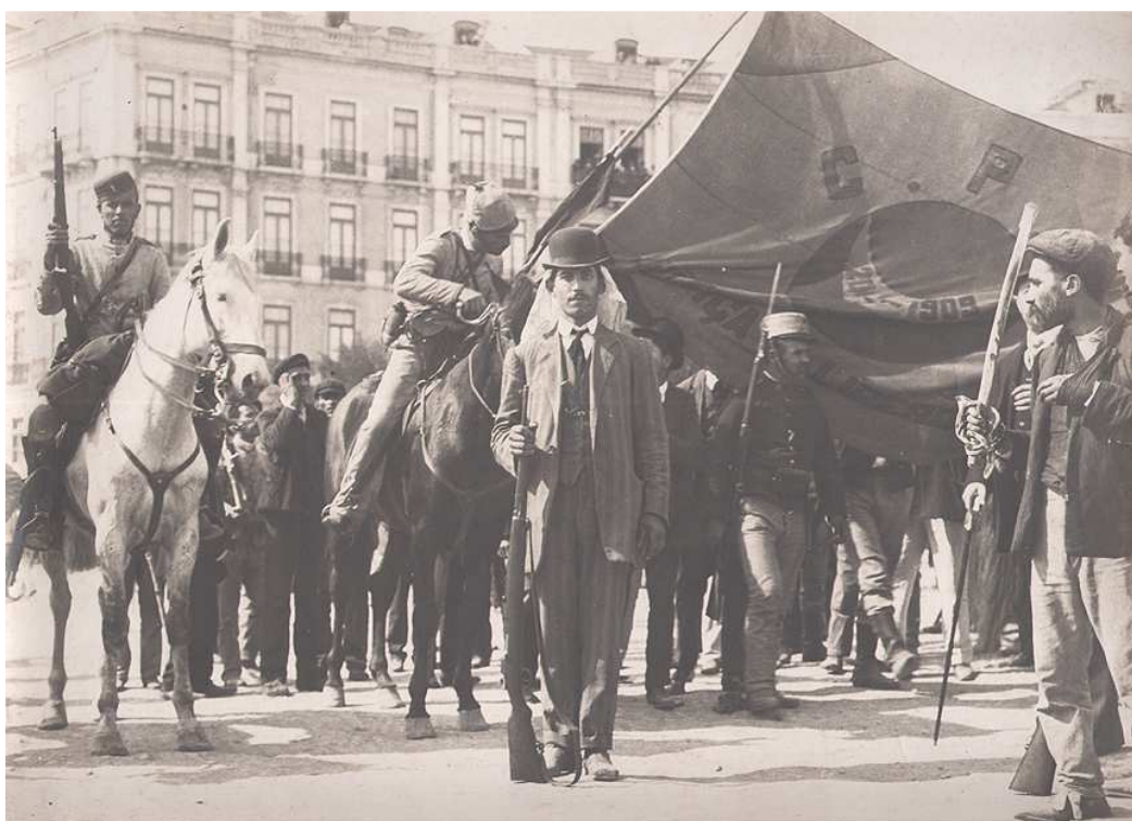
Na Rotunda, a 5 de Outubro de 1910, é bem visível a intervenção da Carbonária, assim como o apoio popular à luta armada.