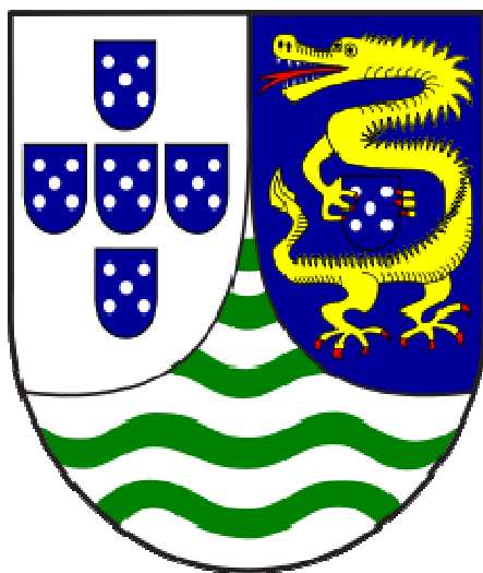
Brasão de Armas de Macau sob domínio português.

O Governo de Macau, querendo criar a sua própria moeda oficial, autorizou, em 1901, o Banco Nacional Ultramarino (BNU) a emitir notas com a denominação de patacas. As primeiras notas impressas começaram a entrar em circulação em 1906 e 1907. Portugal não participou formalmente da Segunda Guerra Mundial (1939-1945); portanto, Macau tornou-se um dos únicos locais do Sudeste Asiático a permanecer neutro frente ao conflito mundial. Por esta razão, um grande número de refugiados chineses, fugindo à ocupação japonesa, foram abrigar-se provisoriamente em Macau, fazendo duplicar a sua população durante aquele período. Esta afluência de refugiados causou muitos problemas, principalmente os relativos à sobrepopulação e à falta de bens alimentares.