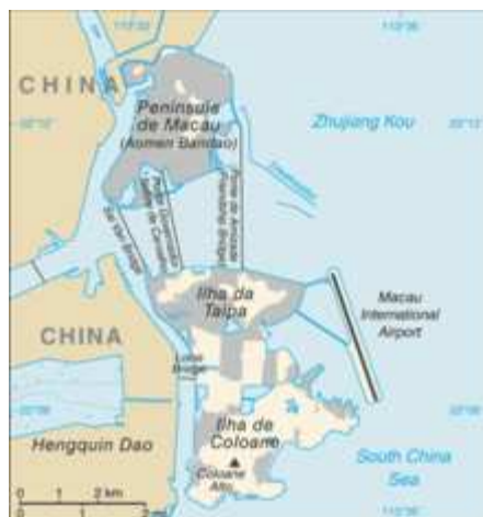
Mapa da R.A.E. de Macau.

Macau localiza-se a 22° 10' Norte (latitude) e 113° 33' Leste (longitude), mas as coordenadas 113° 55' Leste e 21° 11' Norte (a localização exacta do Farol da Guia) também são aceites como sendo as coordenadas geográficas oficiais da localização da RAEM. Esta região administrativa especial está situada na costa meridional da República Popular da China, a oeste da foz do Rio das Pérolas, na ligação entre o Interior da China e o Mar do Sul da China, a sul do Trópico de Câncer, a 145 quilómetros de Cantão (que se situa aproximadamente a norte de Macau) e a 60 quilómetros de Hong Kong, que se encontra no outro vértice da foz do Rio das Pérolas (isto é, situa-se aproximadamente a este de Macau). Macau faz fronteira com a Zona Económica Especial de Zhuhai a