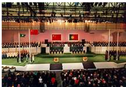
Cerimónia da Transferência de Soberania de Macau para a República Popular da China, que decorreu no início da madrugada de 20 de Dezembro de 1999. Nesta foto, a Bandeira da República Portuguesa e do Leal Senado foram recolhidas (na direita da fotografia) enquanto que a Bandeira da República Popular da China e da Região Administrativa Especial de Macau foram hasteadas (na esquerda da foto).

ocuparam-nas, mas com o terminar da Segunda Guerra Mundial, em 1945, elas foram restituídas à China, devido à incapacidade dos portugueses em reocupá-las. Em 1949, deu-se a fundação da República Popular da China (RPC), de carácter comunista e anticolonialista. Esta nova república declarou o " Tratado de Amizade e Comércio Sino-Português " como um dos muitos tratados desiguais impostos pelas potências europeias à China e por isso foi declarado inválido. Mas, o novo regime não esteve ainda disposto a tratar desta questão histórica dos tratados desiguais, por isso o statu quo de Macau foi provisoriamente mantido. No dia 3 de Dezembro de 1966 ocorreu em Macau um célebre motim popular levantado por chineses pró-comunistas descontentes e fortemente influenciados pela Revolução Cultural de Mao Tse-tung. Este acontecimento é vulgarmente chamado de Motim 1-2-3. Neste dia de protestos, houve 11 mortos e cerca de 200 feridos e foi necessário a mobilização de soldados para controlar a situação. O motim gerou terror e uma grande tensão em Macau, sendo o assunto encerrado apenas em 29 de Janeiro de 1967, com um humilhante pedido de desculpas do Governo de Macau à comunidade chinesa local. Este motim fez também com que Portugal renunciasse a sua ocupação perpétua sobre Macau [5] e reconhecesse o poder e o controlo de facto dos chineses sobre Macau, marcando o princípio do fim do período colonial desta cidade.