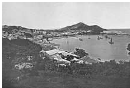
Foto de Macau em 1870.