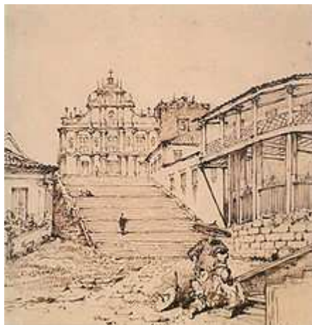
Ruínas de São Paulo, George Chinnery (1774–1852). A catedral foi construída em 1602 e destruída por um incêndio em 1835. Somente a fachada sul chegou aos dias de hoje.

Desde então, Macau desenvolveu-se como um entreposto e intermediário para o comércio triangular entre a China, o Japão e a Europa, numa época em que as autoridades da China proibiram o comércio directo com o Japão por mais de cem anos. Este comércio lucrativo trouxe enorme prosperidade para Macau, tornando-a numa grande cidade comercial e ajudando-a a atingir o seu auge durante os finais do século XVI e os inícios do século XVII. Para além de ser um entreposto comercial, Macau desempenhou também um papel activo e fulcral na disseminação do Catolicismo, ao tornar-se num importante ponto de formação e de partida de missionários católicos para os diferentes países do Extremo Oriente, principalmente para a China. Por este motivo, o Papa Gregório XIII criou, em 1576, a Diocese de Macau, com sede obviamente em Macau. Estes missionários desempenharam também um papel importante no intercâmbio cultural, científico e artístico entre a China e o Ocidente, e no desenvolvimento da cultura e da educação de Macau. Em 1583, foi criada o Leal Senado, a sede e o símbolo do poder e do governo local, pelos moradores portugueses, mais precisamente pelos comerciantes, de Macau. Este organismo político, considerado como a primeira câmara municipal de Macau, foi fundada com o objetivo de proteger o comércio controlado por Macau, de