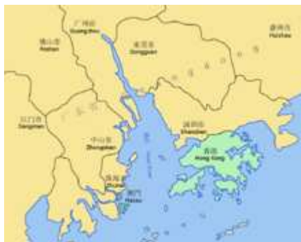
Localização de Macau no Delta do Rio das Pérolas ( Pearl River ) e em relação a Hong Kong e a Cantão (que se situa na prefeitura de Guangzhou e na província de Guangdong).

norte e a oeste, logo é adjacente à província de Guangdong. Outras principais cidades próximas de Macau incluem a Zona Económica Especial de Shenzhen.