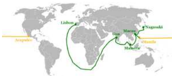
Mapa onde mostra Macau e a sua posição nas rotas comerciais portuguesas e espanholas, no seu período mais próspero (finais do século XVI e princípios do século XVII).

Os portugueses estabeleceram-se ilegal e provisoriamente em Macau entre 1553 e 1554, sob o pretexto de secar a sua carga. Em 1557, as autoridades chinesas deram finalmente autorização para os portugueses se estabelecerem permanentemente em Macau, concedendo-lhes um considerável grau de autogovernança. Em troca, os portugueses foram obrigados a pagar aluguer anual (cerca de 500 taéis de prata) e certos impostos a estas autoridades, que defendiam que Macau continuava a ser parte integrante do Império Chinês. As autoridades chinesas, desde sempre portadoras de algum medo e desprezo pelos estrangeiros, passaram a supervisionar atentamente os portugueses de Macau e a exercer, até meados do século XIX, uma grande influência na administração deste estabelecimento comercial.